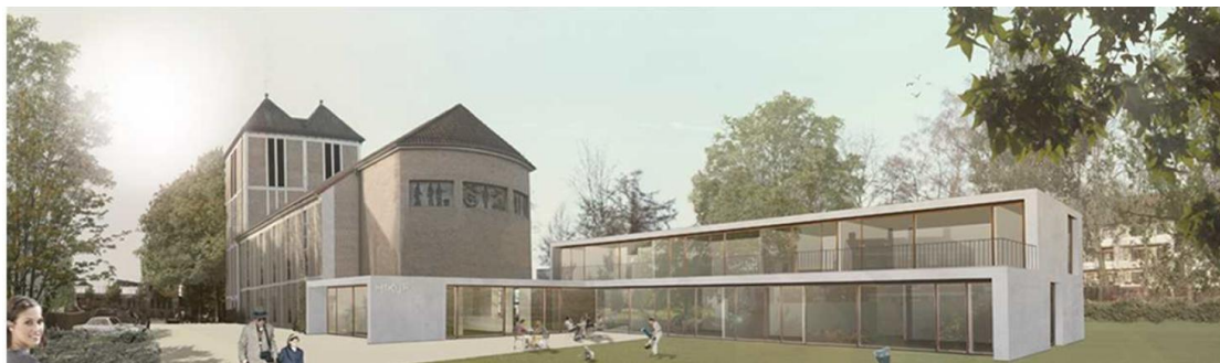
0-10: Projektskizze St. Nikolaus Bremen

Beide Gebäude (Kirche und Kindergarten) werden im Niedrig-Energie-Standard gebaut. Es ist geplant, eine zentrale Wärme- und Stromerzeugung für alle Gebäude über ein Blockheizkraftwerk (BHKW) zu schaffen. Diese Idee wurde bisher noch nicht realisiert.