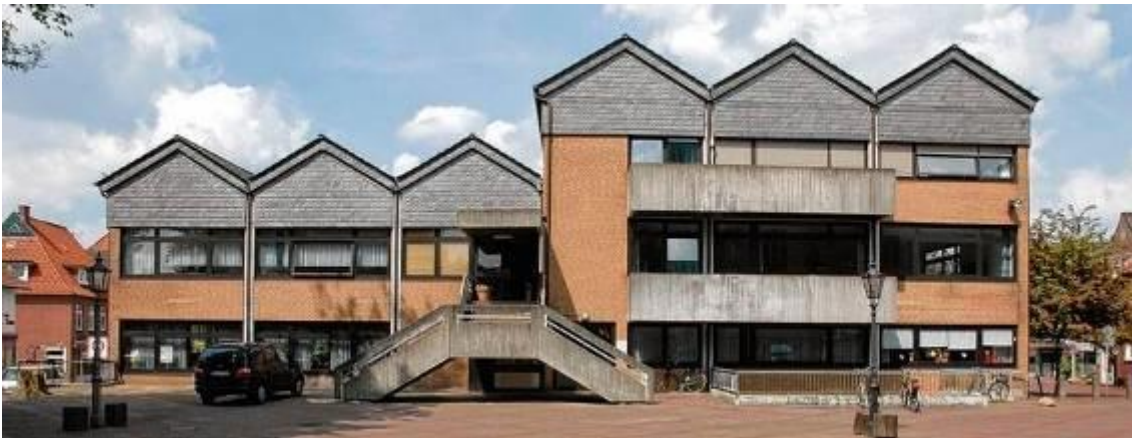
0-1: Gemeindehaus St. Vitus Meppen vor der Sanierung

Für die Liegenschaft St. Vitus-Meppen sind die Einsparpotenziale berechnet worden. Dringender Handlungsbedarf bestand im Hinblick auf die energetische Situation des Gemeindehauses, das deshalb umgebaut und energetisch saniert wurde. Das Konzept für das Gemeindehaus sieht im Wesentlichen die Neugliederung der drei Eingangsbereiche sowie eine komplette Fassadensanierung beziehungsweise -erneuerung mit neuer Dämmung vor.