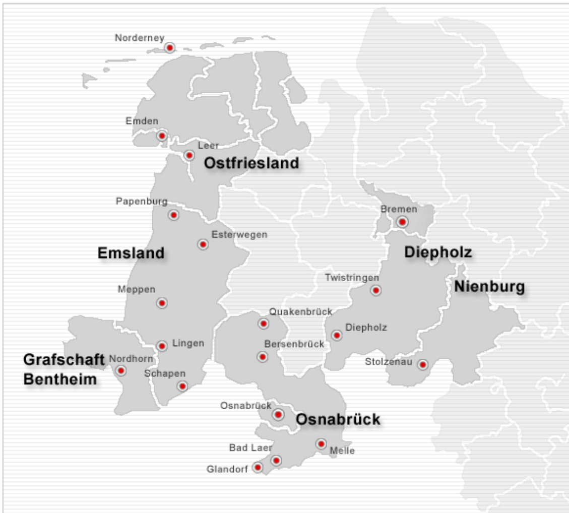
0-1: Karte Bistum Osnabrück

Das Bistum Osnabrück besteht aus zehn Dekanaten. In 231 Kirchengemeinden leben ca. 582.000 Katholiken. Das Bistum Osnabrück ist bunt: Es reicht von der Nordsee-Küste und den Inseln, über Geestlandschaften bis zu den Mittelgebirgen im Süden. Großstädte wie Bremen und Osnabrück, Heilbäder und Industriestädte sind genauso Bestandteil des Bistums wie ländliche Regionen mit kleinen Dörfern. Gleichzeitig besteht es aus Gebieten mit tiefkatholischer Prägung und Diasporaregionen. Es umfasst folgende kommunale Gebietskörperschaften: