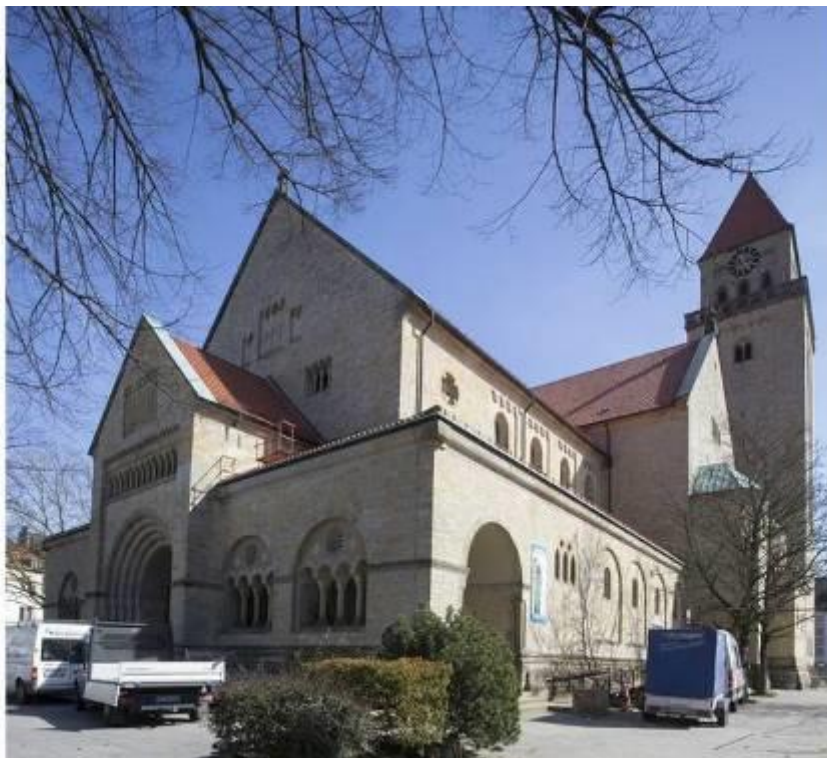
0-3: St. Joseph Osnabrück

Für die Kirche St. Joseph in Osnabrück bestand Bedarf für eine Grundrenovierung. Feuchtigkeit griff Malereien und Putz an. Da die Anzahl der Gemeindemitglieder gesunken ist, hatte man die Idee, das Gemeindehaus in die Kirche zu verlegen. Ein großer Vorteil dabei ist, dass durch den Verkauf des bisherigen Gemeindehauses Gelder für die Investitionen an der Kirche zur Verfügung gestellt werden können. Genau 100 Jahre nach der Grundsteinlegung wurde die Kirche am 24.08.2013 wieder eröffnet.