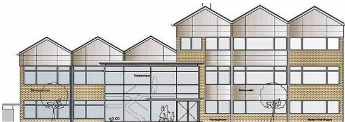
0-2: Plan Gemeindehaus St. Vitus Meppen nach der Sanierung

Das Haus aus den 1970er-Jahren wurde so gut gedämmt und technisch verbessert, dass bis zu 80 Prozent des Heizbedarfs eingespart werden kann. Neben Fassadendämmung und