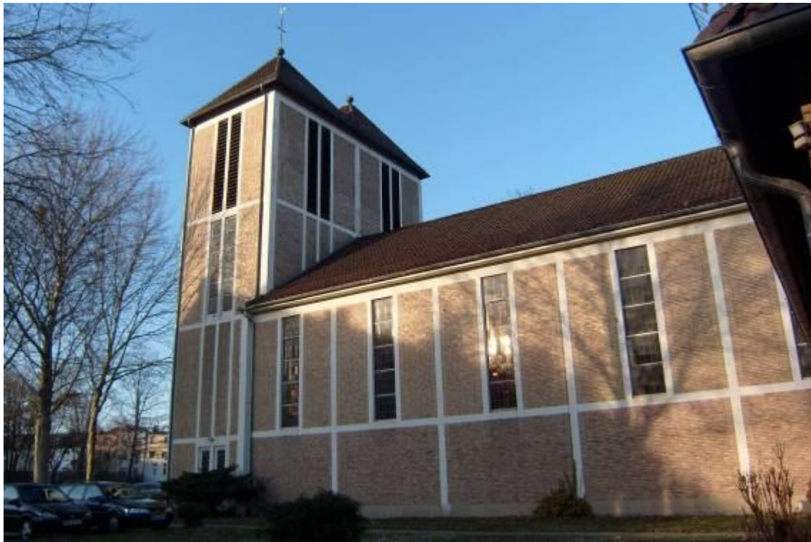
0-9: Kirche St. Nikolaus in Bremen