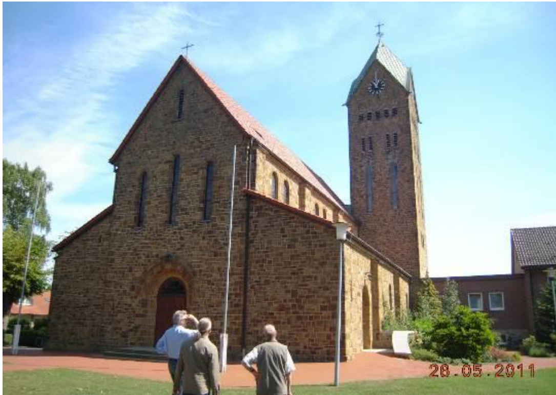
0-5: Kirche St. Martinus Bramsche

Das Gemeindehaus, wie in Abbildung 10-7 zu erkennen, liegt nun links von der Kirche.