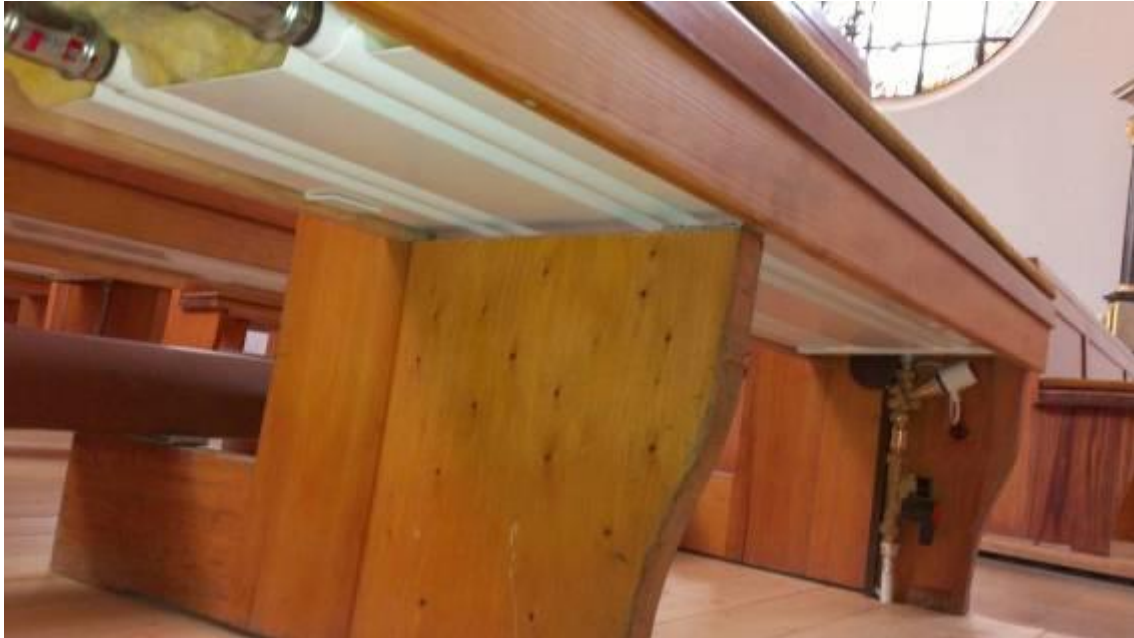
0-8: Bild der Bankheizung in St. Joseph Börgerwald

Lüftungsheizung gehalten werden. Die bestehende Lüftungsheizung wurde modernisiert, indem die Direktbefeuerung mit einem Gasbrenner durch ein Warmwasser-Heizregister ersetzt und eine hydraulische Anbindung an die neue Gas-Brennwertheizung geschaffen wurde. Die Lüftungsheizung soll demnächst nur noch bei niedrigen Außentemperaturen, Großveranstaltungen und dann anspringen, wenn die Fußboden- und Bankheizung die Stütztemperatur nicht halten können.