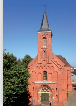
St. Ludgerus (Norden)