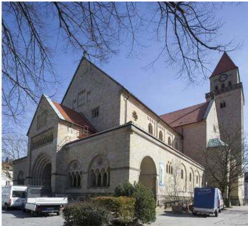
10-3: St. Joseph Osnabrück

Für die Kirche St. Joseph in Osnabrück bestand Bedarf für eine Grundrenovierung. Feuchtigkeit griff Malereien und Putz an. Da die Anzahl der Gemeindemitglieder gesunken ist, hatte man die Idee, das Gemeindehaus in die Kirche zu verlegen. Ein großer Vorteil dabei ist, dass durch den Verkauf des bisherigen Gemeindehauses Gelder für die Investitionen an der Kirche zur Verfügung gestellt werden können. Genau 100 Jahre nach der Grundsteinlegung wurde die Kirche am 24.08.2013 wieder eröffnet.