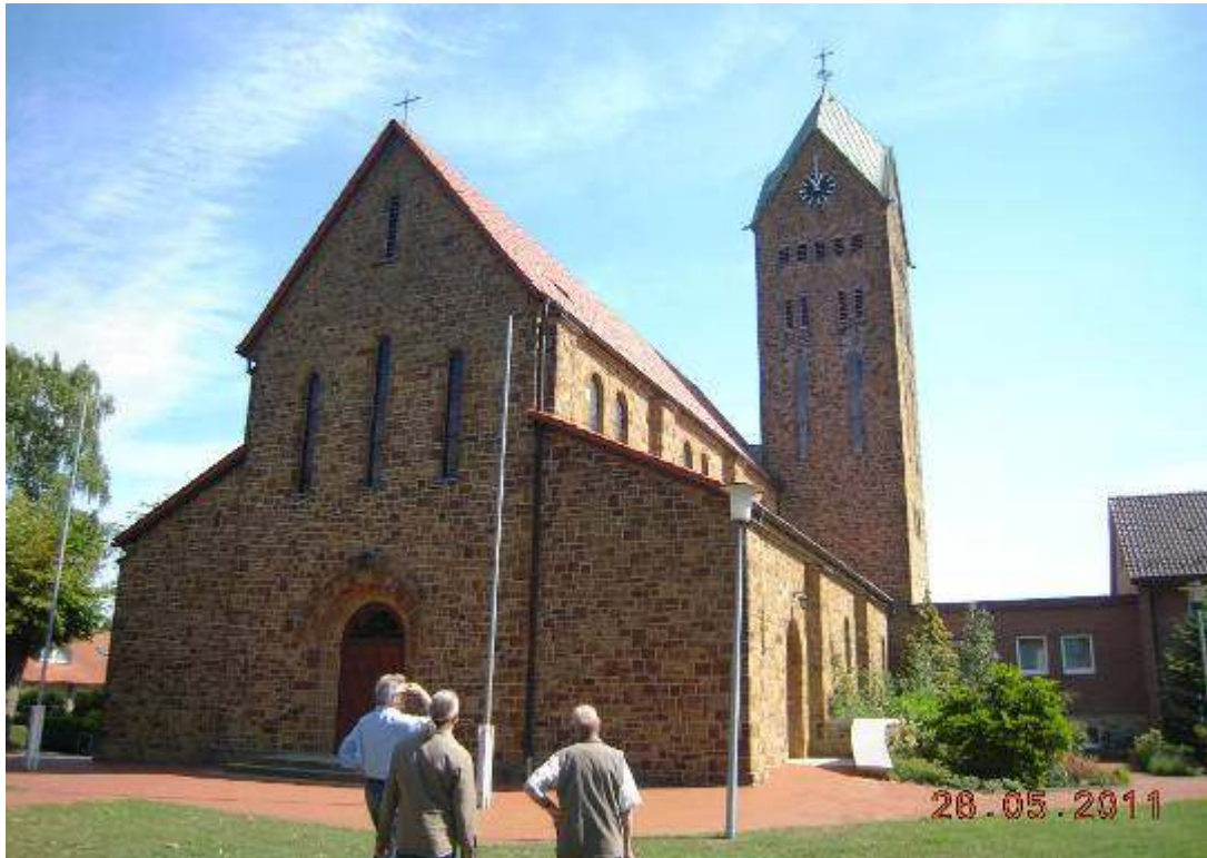
10-5: Kirche St. Martinus Bramsche

Das Gemeindehaus, wie in Abbildung 10-7 zu erkennen, liegt nun links von der Kirche.