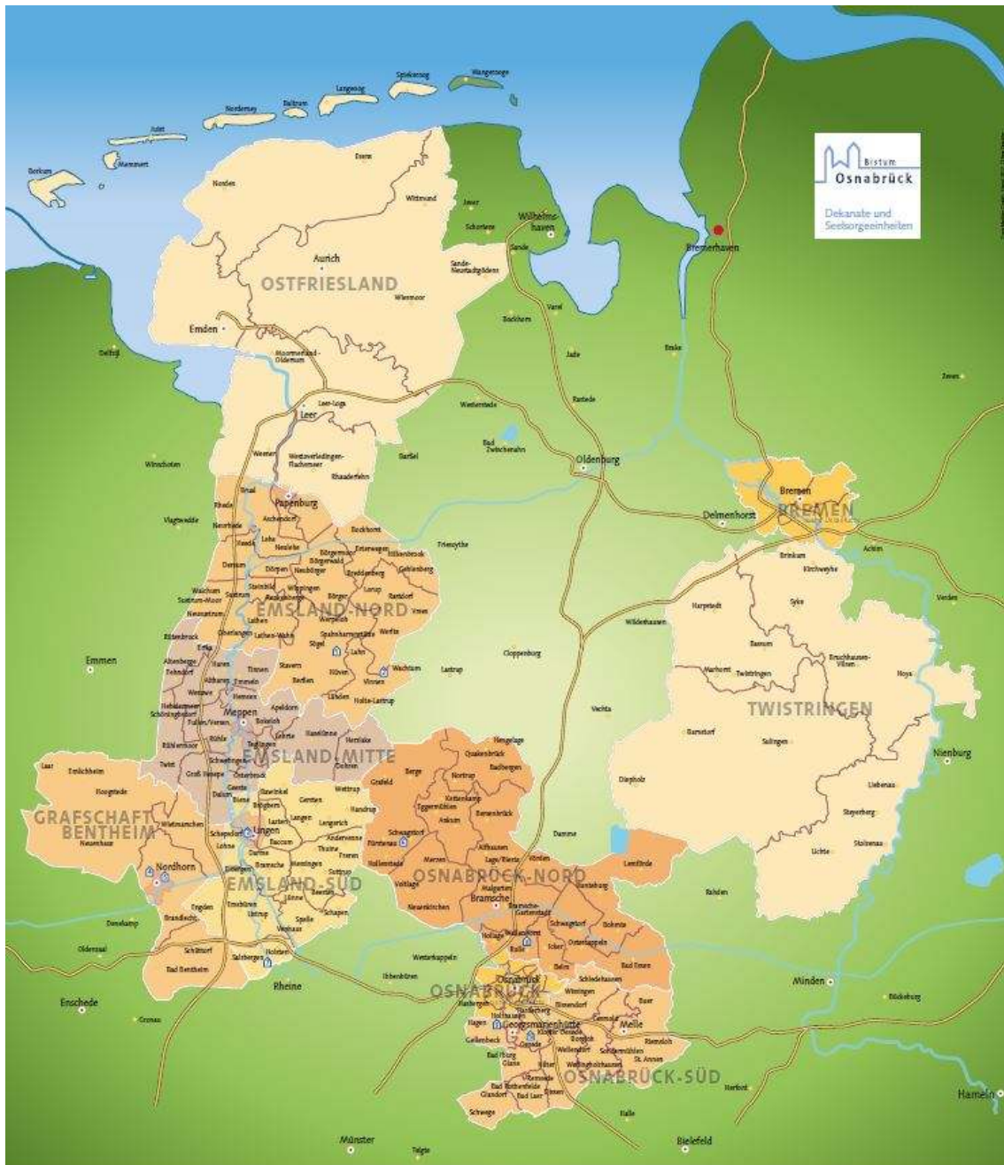
2-1: Karte des Bistums Osnabrück

Das Bistum Osnabrück besteht aus zehn Dekanaten. In 231 Kirchengemeinden leben ca. 582.000 Katholiken. Das Bistum Osnabrück ist bunt: Es reicht von der Nordsee-Küste und den Inseln, über Geestlandschaften bis zu den Mittelgebirgen im Süden. Großstädte wie Bremen und Osnabrück, Heilbäder und Industriestädte sind genauso Bestandteil des Bistums wie ländliche Regionen mit kleinen Dörfern. Gleichzeitig besteht es aus Gebieten mit tiefkatholischer Prägung und Diasporaregionen. Es umfasst folgende kommunale Gebietskörperschaften: