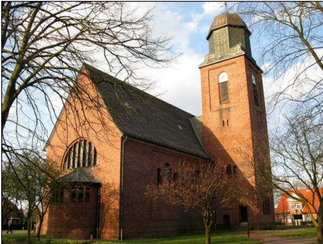
10-7: Kirche St. Josef Börgerwald

Zum 100jährigen Bestehen der St. Josef-Kirche in Börgerwald im Jahre 2013 wurde die Kirche renoviert und umgestaltet. Anfangs war geplant, dass der Chorraum verändert wird, um dort Gottesdienste für 30 bis 35 Personen abhalten zu können. Eine Strahlungsheizung in Form einer Wandheizung an den Chorraumwänden sollte bis zu 20 Prozent der Heizkosten einsparen, weil das große Kirchenschiff bei solchen Gottesdiensten nicht mehr geheizt werden muss.