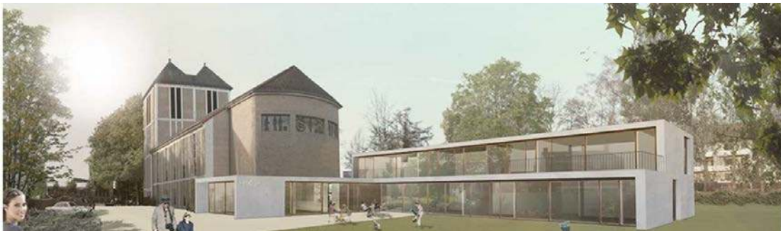
10-10: Projektskizze St. Nikolaus Bremen

Beide Gebäude (Kirche und Kindergarten) werden im Niedrig-Energie-Standard gebaut. Es ist geplant, eine zentrale Wärme- und Stromerzeugung für alle Gebäude über ein Blockheizkraftwerk (BHKW) zu schaffen. Diese Idee wurde bisher noch nicht realisiert.