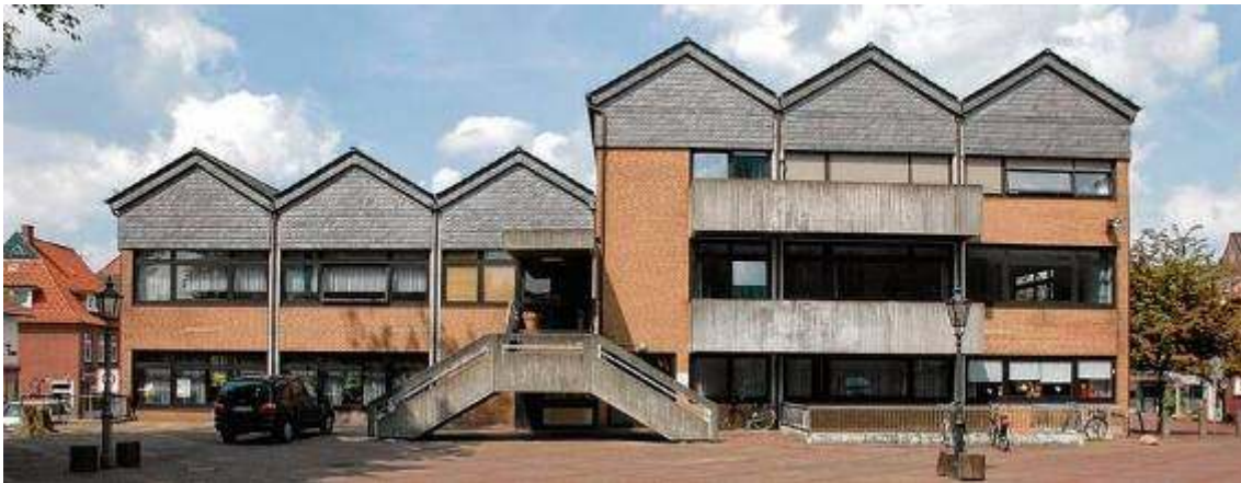
10-1: Gemeindehaus St. Vitus Meppen vor der Sanierung

Für die Liegenschaft St. Vitus-Meppen sind die Einsparpotenziale berechnet worden. Dringender Handlungsbedarf bestand im Hinblick auf die energetische Situation des Gemeindehauses, das deshalb umgebaut und energetisch saniert wurde. Das Konzept für das Gemeindehaus sieht im Wesentlichen die Neugliederung der drei Eingangsbereiche sowie eine komplette Fassadensanierung beziehungsweise -erneuerung mit neuer Dämmung vor.