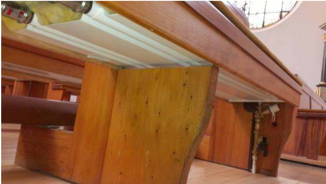
10-8: Bild der Bankheizung in St. Joseph Börgerwald

soll demnächst nur noch bei niedrigen Außentemperaturen, Großveranstaltungen und dann anspringen, wenn die Fußboden- und Bankheizung die Stütztemperatur nicht halten können.