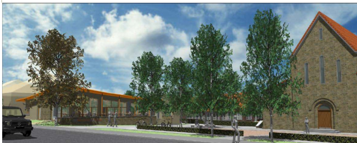
10-6: Graphik zur Lage des neuen Gemeindehauses in St. Martinus Bramsche

Für die Kirchenburg mit Kirche, Pflegeheim, Kindergarten und der zukünftigen Kindertagesstätte wurde ein Energiekonzept erstellt, welches Möglichkeiten einer zentralen oder dezentralen Versorgung betrachtet. Aufgrund der Ergebnisse wurde eine zentrale Versorgung empfohlen. Vonseiten der Stephanswerk-Wohnungsbaugesellschaft wurde jedoch eine Insellösung favorisiert