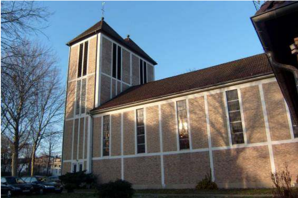
10-9: Kirche St. Nikolaus in Bremen