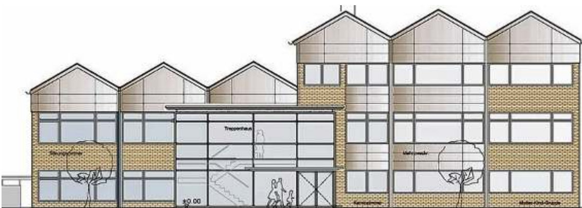
10-2: Plan Gemeindehaus St. Vitus Meppen nach der Sanierung

Das Haus aus den 1970er-Jahren wurde so gut gedämmt und technisch verbessert, dass bis zu 80 Prozent des Heizbedarfs eingespart werden kann. Neben Fassadendämmung und Dreifachverglasung der Fenster ist eine Lüftungsanlage mit Wärmerückgewinnung in Kombination mit einem Erdwärmetauscher und einer Gasbrennwertheizung installiert worden.