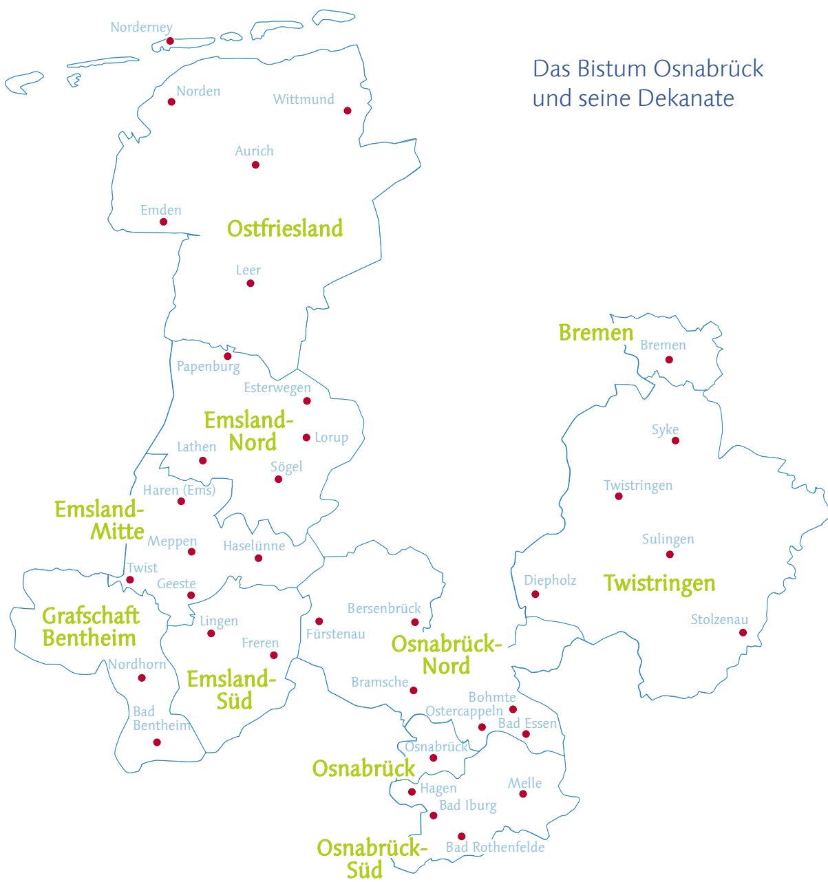
Das Bistum Osnabrück und seine Dekanate